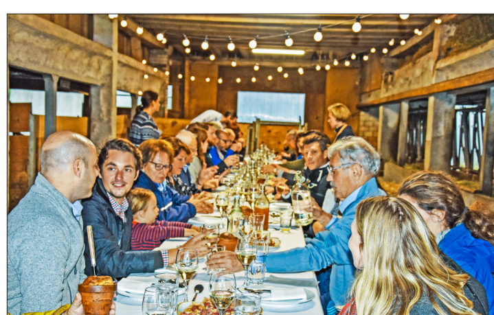
Im Tenn des Kuhstalls lässt es sich kulinarisch verwöhnen.